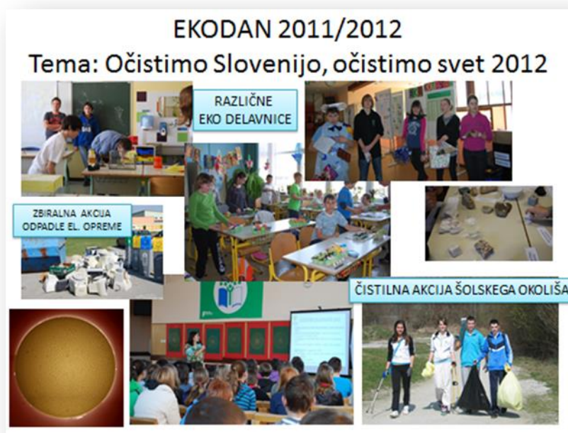
Slika 5: Očistimo Slovenijo 2012

V sklopu ekodneva je potekala tudi zbiralna akcija papirja, elektronske in električne opreme, baterij in sijalk , s katero smo želeli opozoriti na smisel ločevanja, recikliranja in posledično zmanjševanja odpadkov.