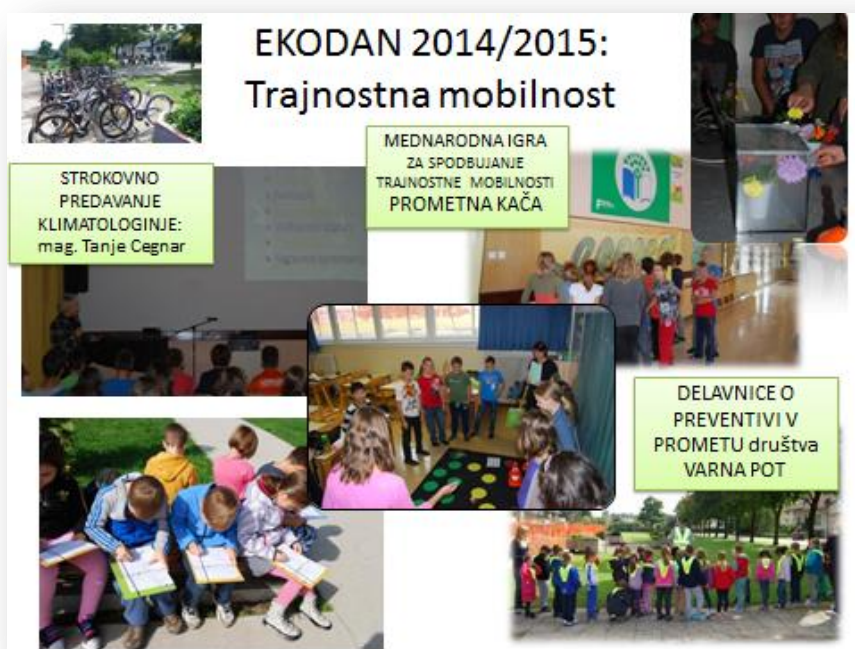
Slika 7: Trajnostna mobilnost

Ekodan je bil zelo uspešen, kar so potrdili tudi rezultati igre Prometna kača, saj smo povečali trajnostni prihod v šolo v dvotedenskem obdobju za več kot 20 odstotkov. Tudi večina zaposlenih na OŠ Domžale je na ekodan prišla v šolo trajnostno in tako z lastnim zgledom ozavestila pomen varovanja okolja pri vsakem izmed nas.