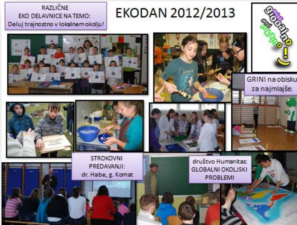
Slika 5: Razmišljaj globalno, deluj lokalno!

čaj... Predstavilo se je tudi ekološko čebelarstvo s svojimi izdelki. Oboji smo bili zelo zadovoljni, mi, ki smo lahko kupili zdrave pridelke, in kmetje, ki so jih uspešno promovirali in prodali.