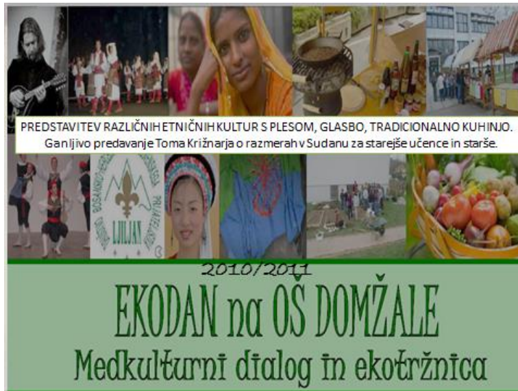
Slika 3: Medkulturni dialog in ekotržnica