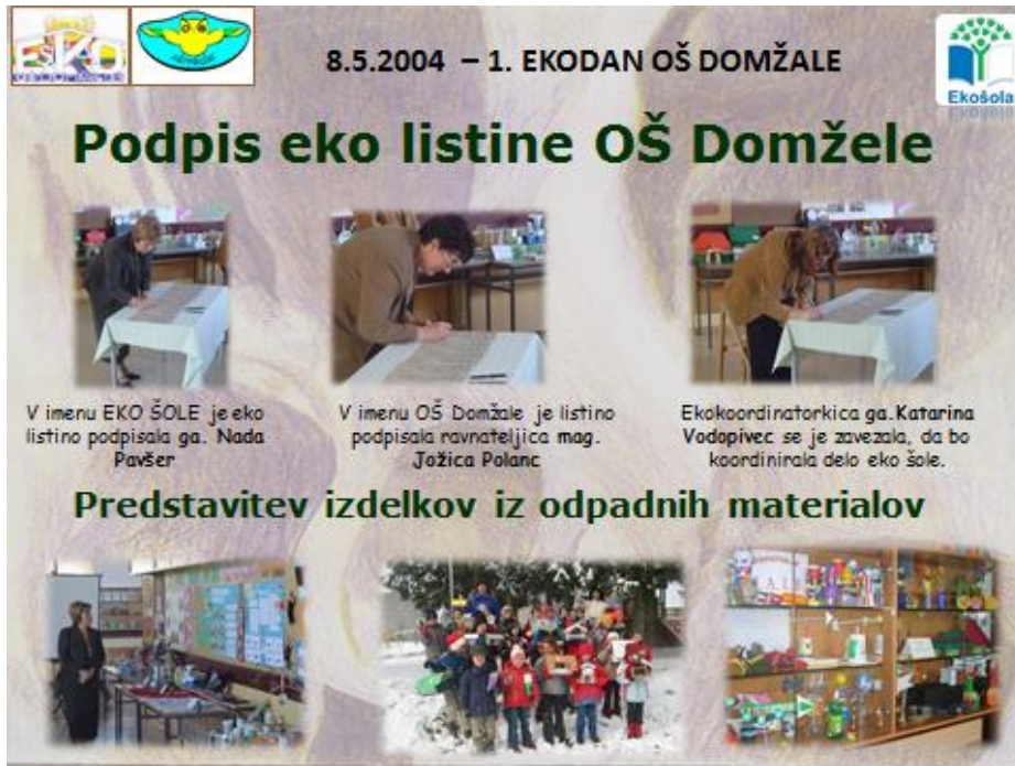
Slika 1: Prvi ekodan na OŠ Domžale: slavnostni podpis ekolistine

Zato smo prvi ekodan povezali s »predelavo odpadkov« v različne uporabne izdelke, ki smo jih ob slavnostnem podpisu ekolistine razstavili v šolski avli. Na slovesnosti so učenci predstavili tudi različne ekološko obarvane raziskovalne naloge in druge dejavnosti.