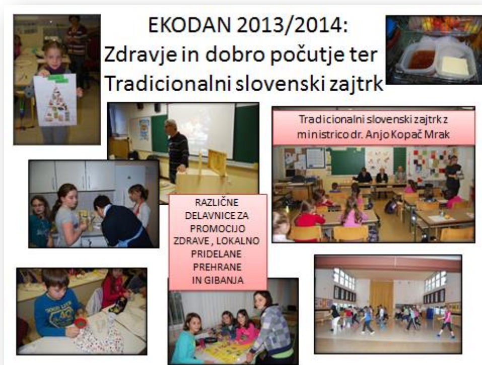
Slika 6: Zdravje in dobro počutje